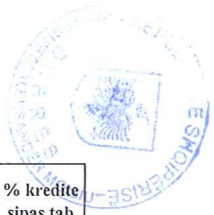
Tabela sipas VKM 879 SPECIALIST RRJETASH KOMPJUTERIKE