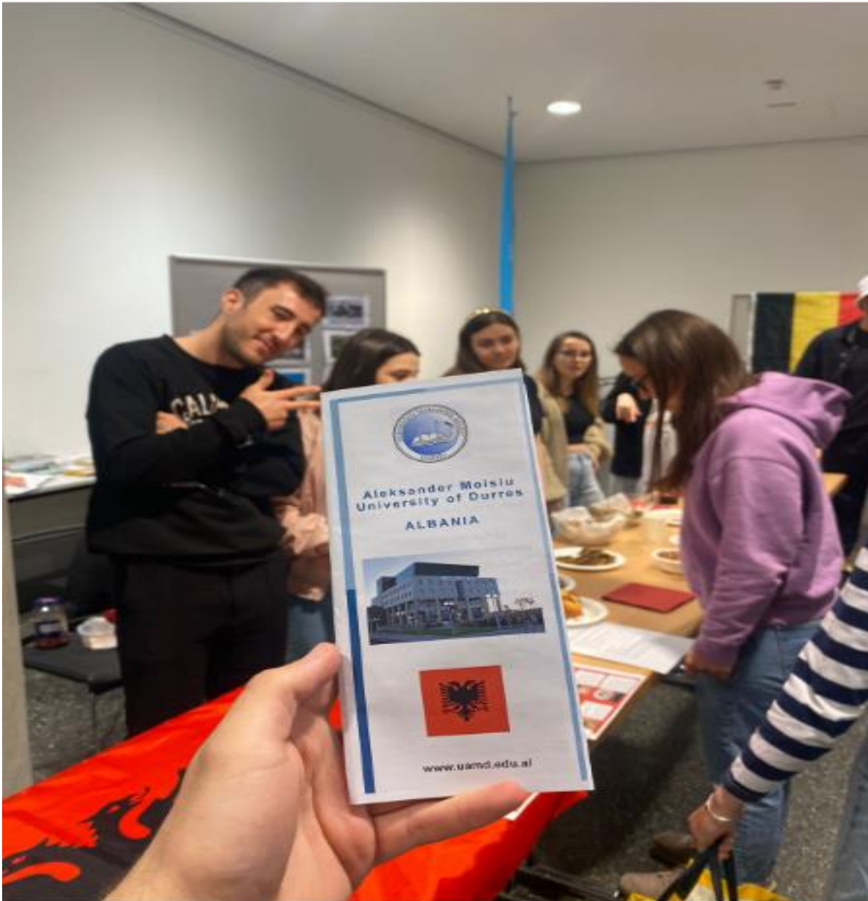
Fig.1. Studentët e UAMD në ditën kulturore në universitetet partnere