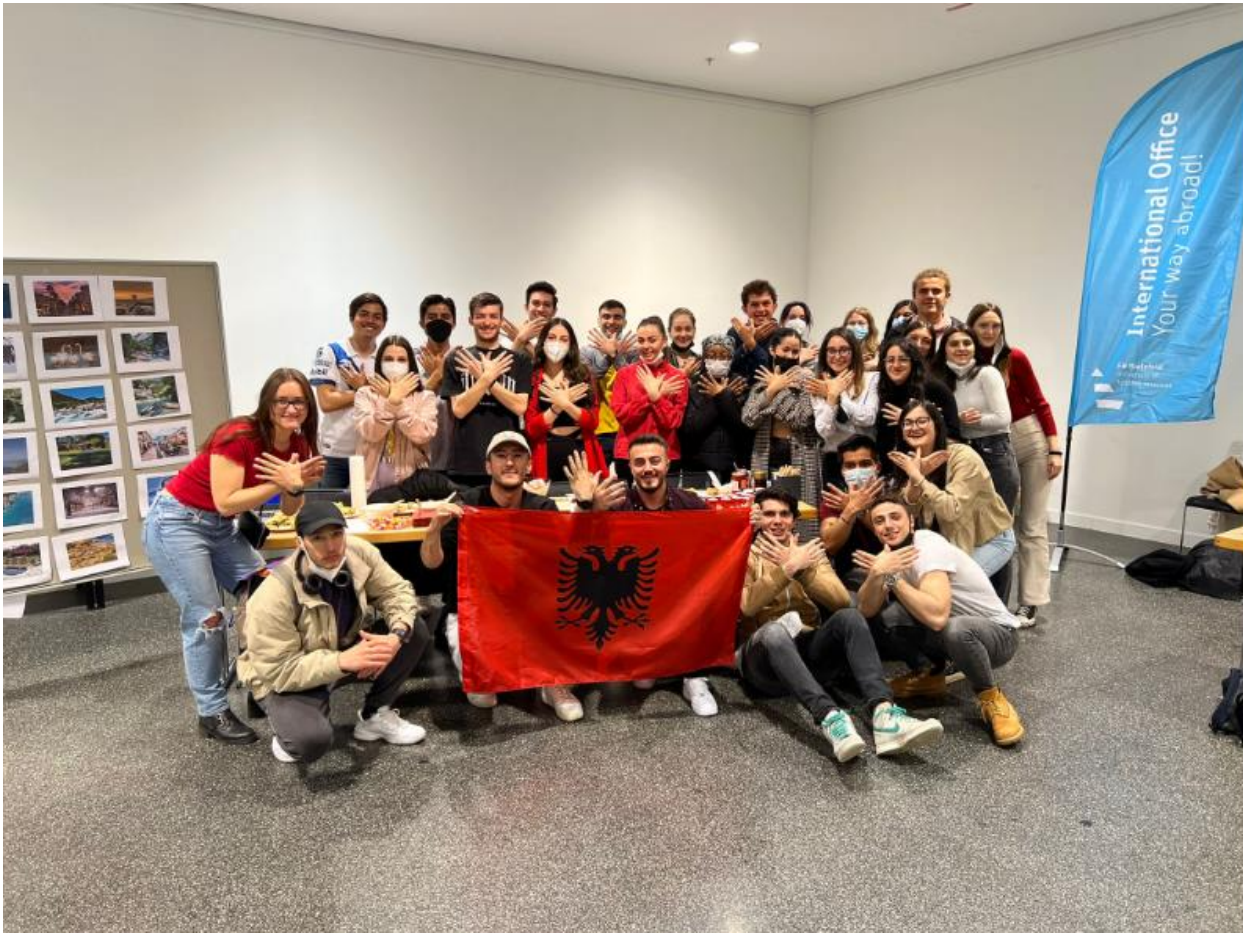
Fig.3 Studentët e huaj Erasmus+ në Universitetin e Shkencave të Aplikuara Bielefeld, Gjermani.