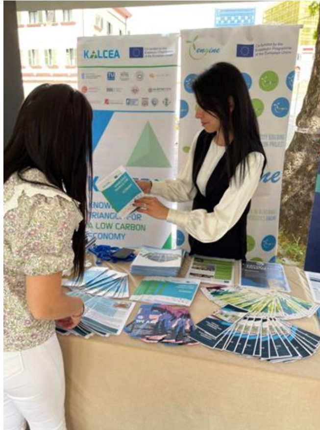
Fig. 4 Ditët informuese Erasmus+