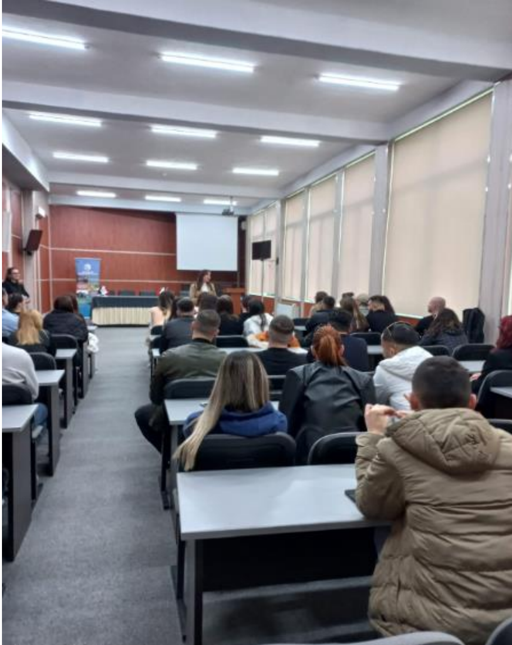
Fig. 2 Shpërndarja e Certifikatave të studentëve përfitues të shkëmbimeve Erasmus+